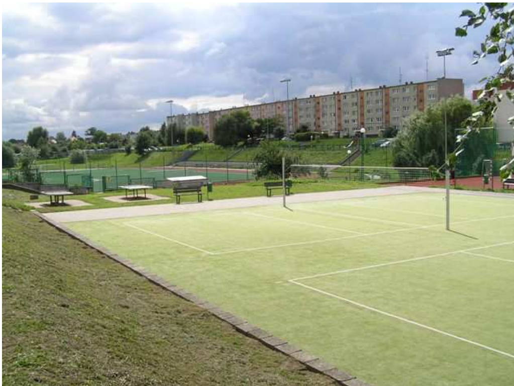
Stadion sportowy przy Gimnazjum im. Olimpijczyków Polskich w Gryfinie.

- Gimnazjum w Gryfinie przystąpiło do użytkowania części zmodernizowanego stadionu 51 (przekazanego przez Urząd Miasta i Gminy w Gryfinie 12 lipca 2006 r.), przed wykonaniem wszystkich robót budowlanych i uzyskaniem decyzji o pozwoleniu na użytkowanie, co naruszało przepis art. 55 pkt 3 ustawy Prawo budowlane 52 . Wbrew przepisom art. 56 ust. 1 pkt 1 ustawy Prawo budowlane, Gmina nie zawiadomiła organu Inspekcji Ochrony Środowiska o zakończeniu budowy obiektu budowlanego i zamiarze przystąpienia do jego użytkowania.