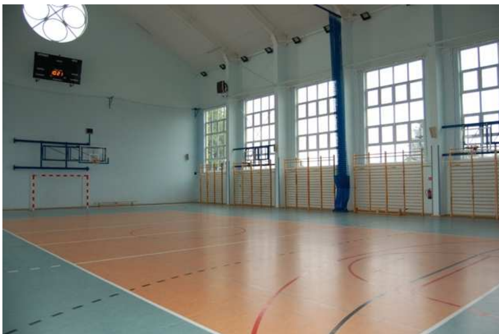
Sala sportowo – widowiskowa w Reczu. Autor – NIK

4. Nieskuteczny nadzór nad uczestnikami procesu inwestycyjnego stwierdzono w 2 gminach, tj.: