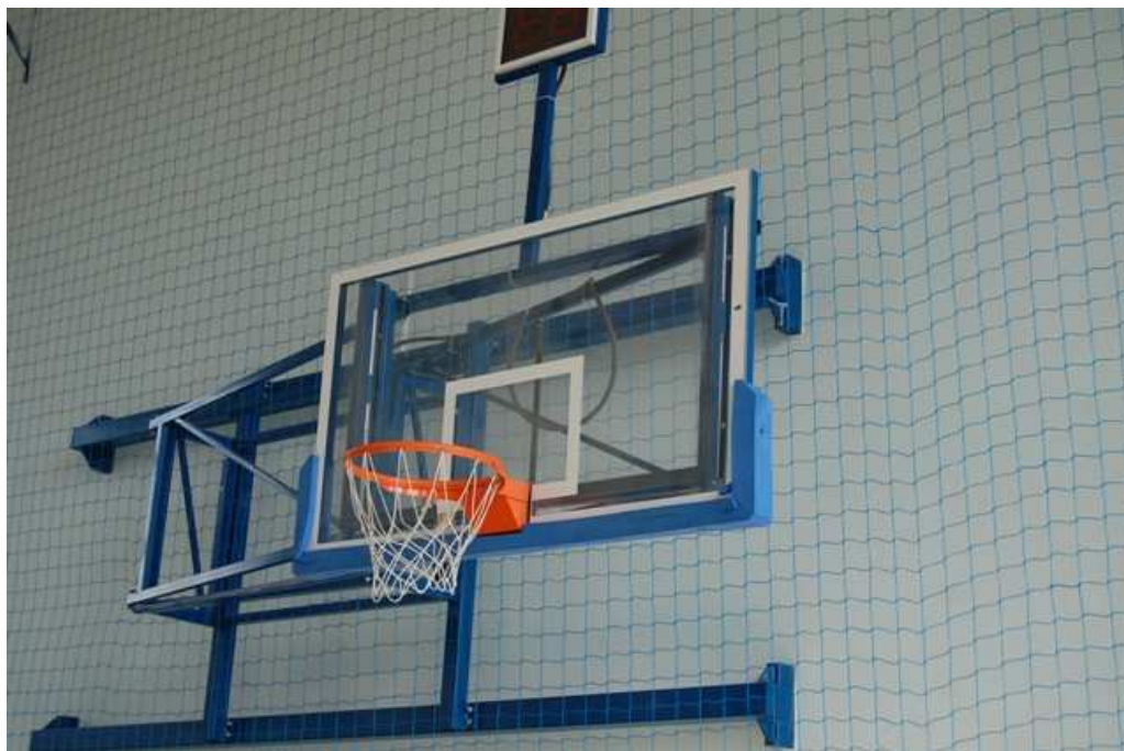
Wyposażenie do gry w koszykówkę (sala sportowo – widowiskowa w Reczu).

2. Wszystkie skontrolowane gminy wywiązały się ze zobowiązań warunkujących otrzymanie dofinansowania ze środków FRKF, zabezpieczając w budżetach gminnych niezbędne środki finansowe, pozwalające na zgodne z przeznaczeniem użytkowanie obiektów sportowych. Administratorami obiektów było 5 szkół (zespoły szkół lub gimnazja działające w formie jednostek budżetowych), Ośrodek Sportu i Rekreacji w Szczecinku (jednostka budżetowa), Centrum Kultury i Sportu w Postominie (samorządowa jednostka kultury) oraz Zarząd Obiektów Sportowych Sp. z o.o. w Koszalinie (samorządowa spółka z ograniczoną odpowiedzialnością, zwana dalej ZOS). Koszty utrzymania obiektów sportowych w przypadku jednostek budżetowych, finansowane były w ramach planów finansowych tych jednostek lub budżetów gmin. Centrum Kultury i Sportu w Postominie i ZOS finansowały koszty z przychodów uzyskiwanych z prowadzonej działalności lub dotacji.