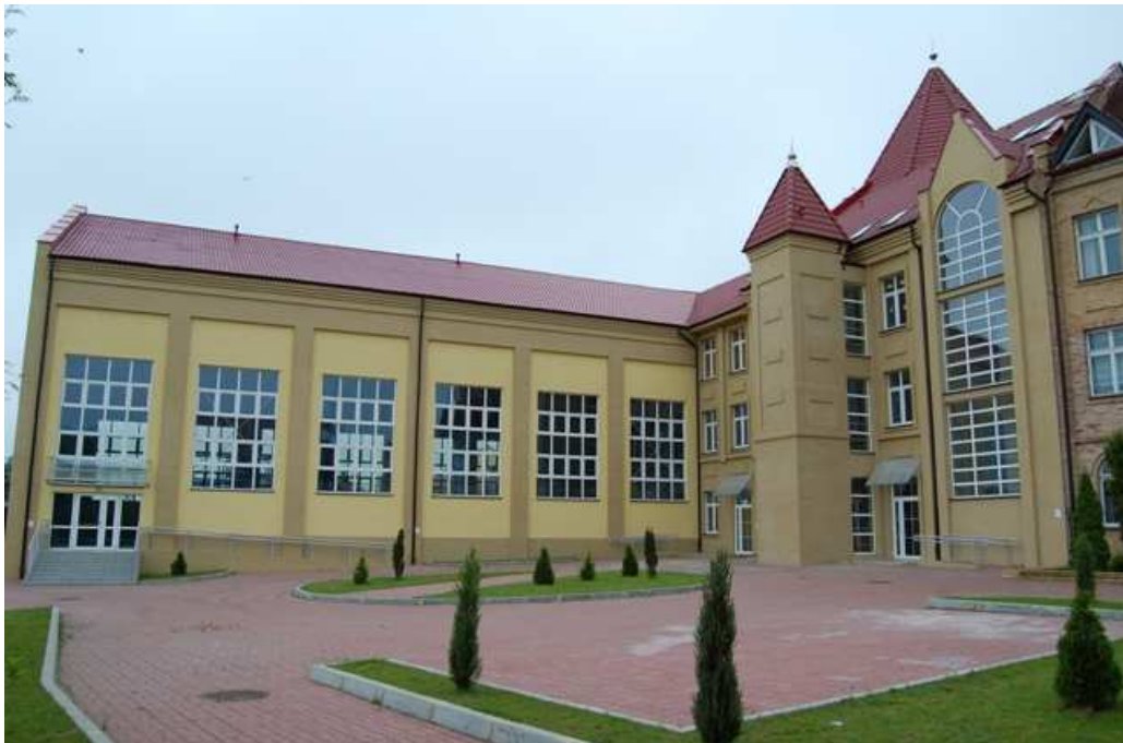
Sala sportowo – widowiskowa w Reczu.