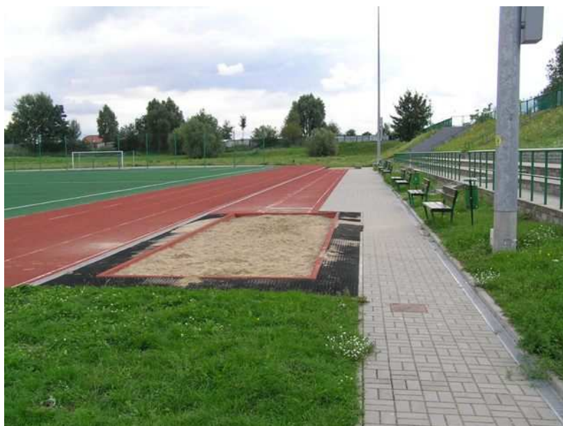
Stadion sportowy przy Gimnazjum im. Olimpijczyków Polskich w Gryfinie.

Dane o przewidywanych i osiągniętych przez gminy efektach użytkowych zawarto w załączniku Nr 6 do informacji.