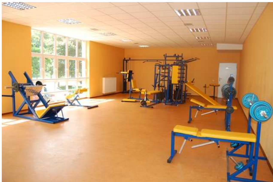
Sala siłowni wykonana w ramach inwestycji realizowanej przez Gminę Recz.

Natomiast odebrany 25 września 2007 r. przez Miasto Koszalin stadion sportowy zawierał wady, uniemożliwiające jego pełne wykorzystanie. Nieskuteczne działania inwestora i wykonawcy podejmowane w okresie 2 lat, spowodowały poniesienie dodatkowych kosztów. Przykładowo na nieskuteczne zabiegi agrotechniczne, które miały przywrócić pełną wartość użytkową boiska 54 wydatkowano kwotę 54,9 tys. zł. Dopiero w 2008 r. i to na okres od 22 października do 31 grudnia 2008 r. (przy maksymalnym wykorzystaniu płyty boiska do 8 godzin tygodniowo) przekazano do eksploatacji płytę główną boiska. Po ponownym przekazaniu do użytkowania boiska z dniem 1 czerwca 2009 r., konieczność wykonania kolejnych prac gwarancyjnych skutkowałą zawieszeniem jego eksploatacji w okresie od 18 lipca do 1 września 2009 r. Pełne przekazanie obiektu nastąpiło dopiero 8 września 2009 r., przy ograniczeniu korzystania z płyty boiska w wymiarze do 20 godzin tygodniowo. Przeprowadzone w toku kontroli ZOS w Koszalinie oględziny stadionu wskazywały na możliwość dalszego występowania wad, polegających na słabej wodoprzepuszczalności płyty boiska.