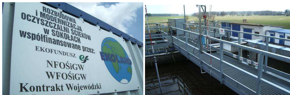
Modernizacja i rozbudowa oczyszczalni ścieków w Sokółkach