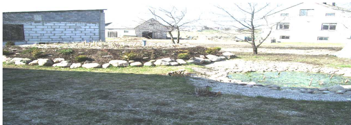
Przydomowa oczyszczalnia ścieków (tzw. „wodno – stawowa”) w Sokolach

Pozytywnym zjawiskiem było także rozpowszechnienie idei budowy przydomowych oczyszczalni ścieków. Do chwili obecnej na terenie 5 skontrolowanych gmin i w powiecie Suwalskim wybudowano 444 takie obiekty.