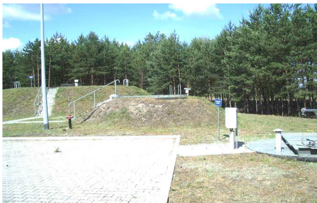
Zmodernizowane oczyszczalnie ścieków w Dubiczach Cerkiewnych i Narewce

Pozytywnym zjawiskiem było także rozpowszechnienie idei budowy przydomowych oczyszczalni ścieków. Do chwili obecnej na terenie 5 skontrolowanych gmin i w powiecie Suwalskim wybudowano 444 takie obiekty.