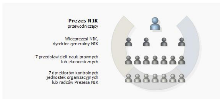
Rys. 1. Schemat składu Kolegium NIK ( opis grafiki )

7 przedstawicieli nauk prawnych lub ekonomicznych oraz 7 dyrektorów kontrolnych jednostek organizacyjnych lub radców Prezesa NIK powołuje na członków Marszałek Sejmu na wniosek Prezesa NIK po zasięgnięciu opinii właściwej komisji sejmowej. Kadencja członka Kolegium trwa 3 lata.