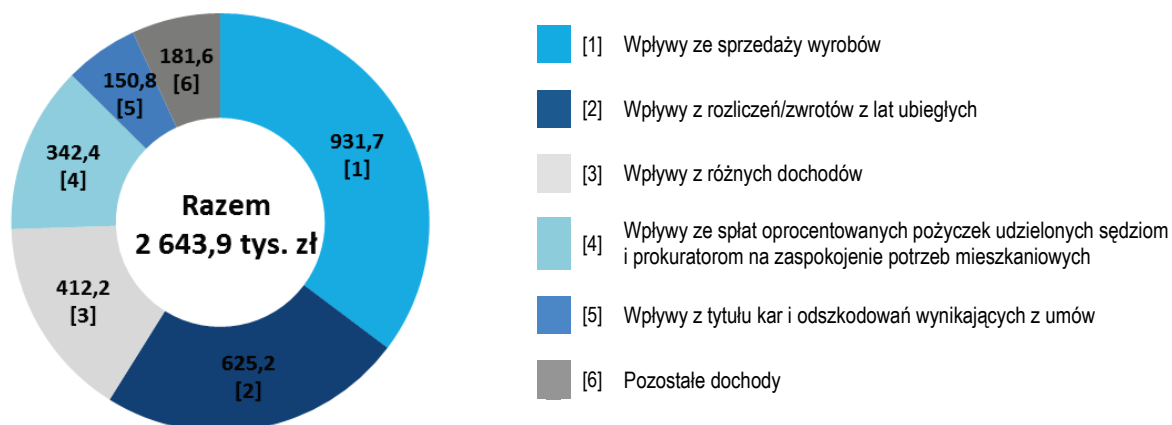
Wykres nr 1 – Kwoty dochodów budżetowych osiągniętych w części 13 – IPN w 2017 r. w tys. zł